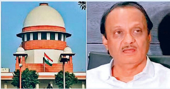
शरद पवार गुट ने की थी शिकायत

मामले को लेकर शरद पवार गुट की ओर से याचिका दायर की गई थी। इसमें वरिष्ठ अधिवक्ता अभिषेक सिंघवी ने कहा था कि अजित पवार गुट के एक एमएलसी ने समर्थन दिखाने के लिए शरद पवार का एक वीडियो क्लिप वायरल किया था।