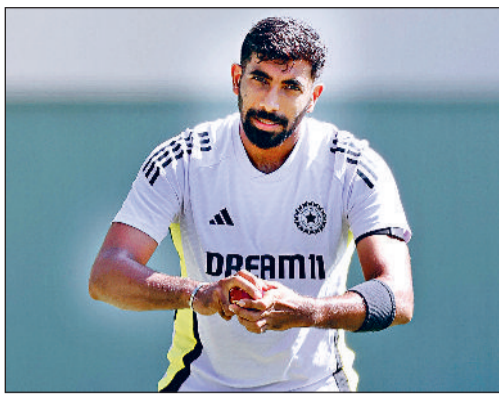
एडम सोज़िजर द्वारा भेजी गई ई-मेल के अनुसार भारतीय टीम के अभ्यास सत्र को देखने से प्रशंसकों को रोक दिया गया है। इसके साथ परिस्तर में काम करने वालों को भी सख्त निर्देश दिए गए हैं कि वे भी टीम के अभ्यास सत्र को और तस्का-इंफॉर्म नहीं करें।

मीडिया कवरेज से कोई रोक नहीं : बीसीसीआई इस बारे में हालांकि जब बीसीसीआई के लोगों से पूछा गया तो उन्होंने इस तरह की आधिकारिक सूचना भेजने से साफ इनकार कर दिया। बीसीसीआई अधिकारी ने गोपनीयता की शर्त पर कहा, 'भारत या भारत ए की टीम से किसी ने ऐसी कोई मांग नहीं की है। किसी ने आधिकारिक क्षमता में बंद दरवाजों के पीछे नेट सत्र की मांग नहीं की है। अभ्यास सत्र मीडिया के लिए खुला है। भारतीय और ऑस्ट्रेलियाई मीडिया जब तक चाहें देख और कवर कर सकते हैं। अभी तक ऐसी कोई रोक नहीं है।'